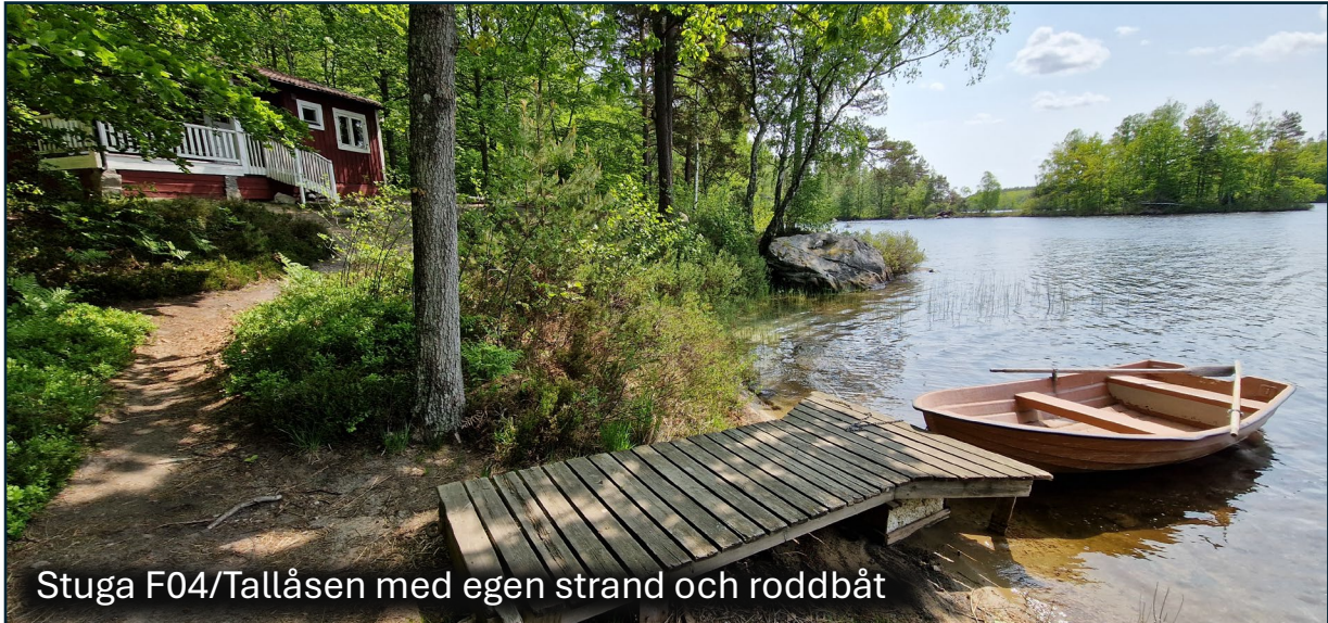
Stuga F04/Tallåsen med egen strand och roddbåt

Alla dessa 50 stugor kan hyras ut i minst 305 dagar per år. Ägarna får nämligen använda sin bostad max 60 dagar per år (varav max 21 dagar under de tre sommarmånaderna), men de flesta ägare använder bara en del av dessa 60 dagar och vi kan därför hyra ut stugorna i ännu mer än 305 dagar per år. Vissa ägare kommer inte ens att använda sin stuga alls för sig själva, eftersom de ser sin stuga enbart som en investering. Mer information om våra stugor, samt bilder och beskrivning, hittar du här: