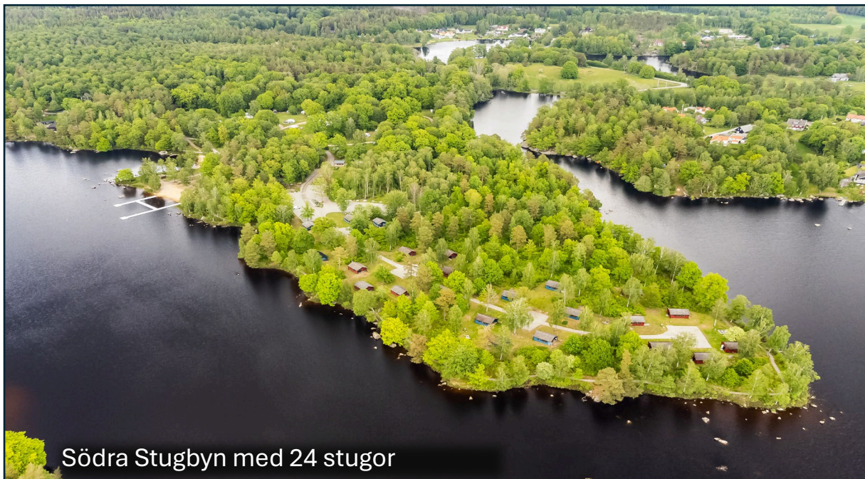
Södra Stugbyn med 24 stugor