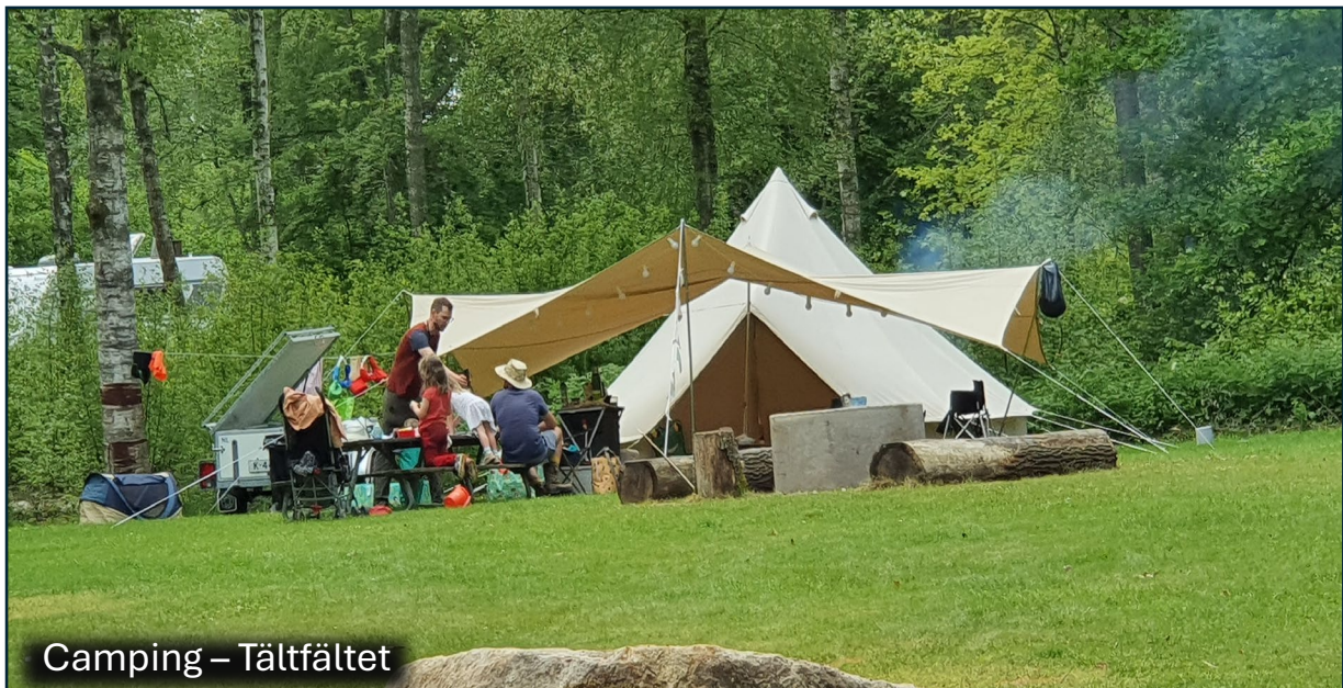
Camping – Tältfältet

Campingen har två servicebyggnader: Den centrala servicebyggnaden, som har blivit varsamt renoverats de senaste åren och en mindre, nybyggd servicebyggnad som byggdes för tre år sedan. I den centrala servicebyggnaden finns förutom duschar och toaletter ett mycket omfattande och modernt kök med alla tänkbara bekvämligheter samt en tvättstuga, bastu, tv-rum, m.m. Alla betaltjänster som duschar, tvättmaskiner och bastu aktiveras med hjälp av ett så kallat Camptrac-kort som varje gäst får och varje gäst kan ladda pengar på detta kort via en datorskärm.